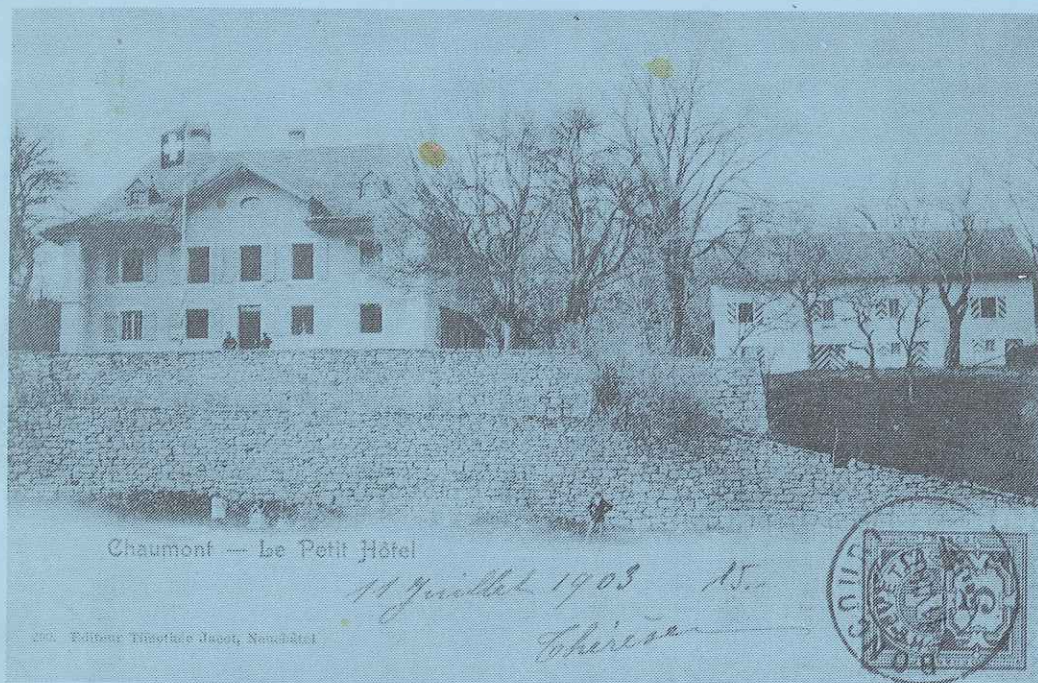
Chaumont — Le Petit Hôtel

JOURNAL DE LA SOCIETE D'INTERET PUBLIC DE CHAUMONT Paraissant 4 x l'an. - 2ème trim. 1981 - No. 12