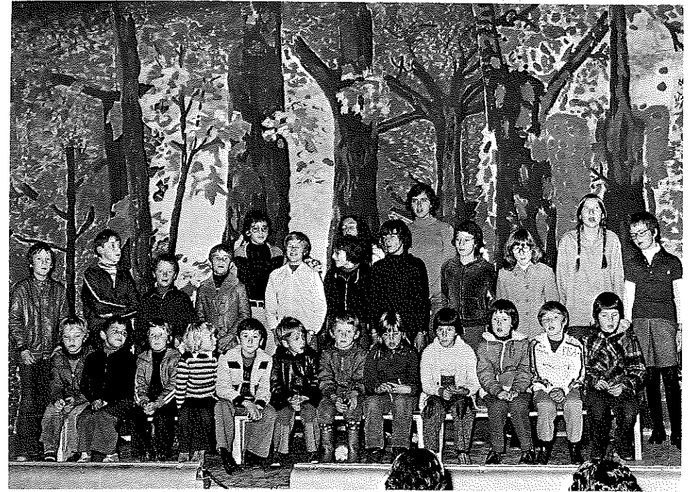
1976. L'école de Chaumont fête ses cent ans