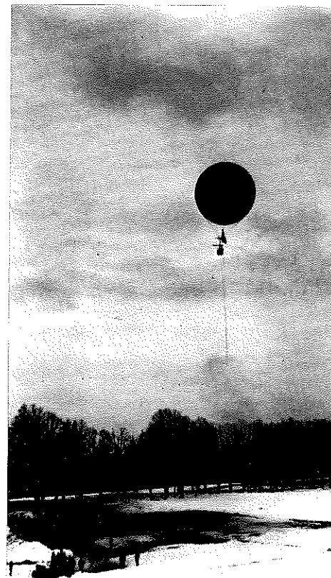
Le ballon captif dans les airs, à la corde d'amarrage. Photographie prise en 1915 à Chaumont.

Nous avons eu la possibilité de découvrir un extraordinaire album de photos consacré à un cours de ballons captifs organisé par l'armée en 1915. Ce document exceptionnel appartient à Monsieur A. Bassin, ancien directeur d'Arrondissement de téléphone, qui a bien voulu le mettre à notre disposition pour que nous puissions reproduire les documents les plus significatifs dans notre petit journal. Nous le remercions vivement et présentons dans ce numéro une première photo. Nous aurons l'occasion prochainement de publier en suite avec des commentaires sur ce cours.