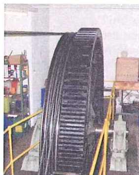
Le treuil de la station de Chaumont datant de 1910 n'est plus conforme

fera définitivement partie du passé. En effet, la partie mécanique du treuil date encore de 1910, est donc vieille de 97 ans et ne répond plus aux prescriptions actuelles.