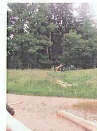
Image impressionnante, ce malheureux sapin n'existait plus, éparpillé en lambeaux dans un rayon de trente mètres.

venait de détruire l'alimentation électrique et téléphonique de nombreuses habitations, sur plusieurs kilomètres, du carrefour de La Charrière jusqu'aux environs de La Dame. En fait, la foudre s'est abattue sur un gros sapin, à 100 mètres au Sud de la ferme Pierrehumbert.