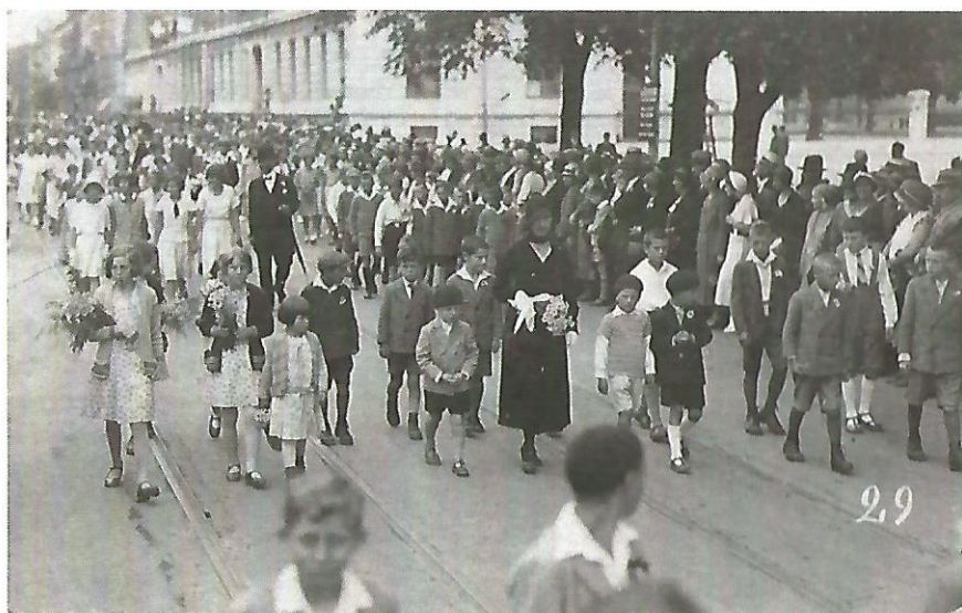
En 1933 ou 1934

Il fallait aider à papa à étendre les taupinières avec un râteau en fer et ramasser les cailloux sur tout le domaine, de même, il fallait enlever les branches qui se trouvaient le long des haies, je faisais des petits feux de ci, de là. Je conduisais également Bijou (notre cheval) aux labours à la herse.