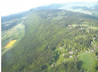
Crête de Chaumont

Une odeur de kérosène se fait sentir dans la cabine ce qui met dans l'ambiance. En bout de piste, les gaz à fond, une forte poussée va faire décoller l'avion qui prend tout de suite de la hauteur. Rien à voir avec un petit avion de tourisme qui rase presque la cime des arbres en dessus du camping.