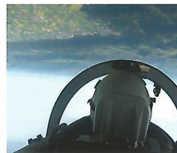
Tête en bas ou paysage à l'envers !

Ensuite nous prenons la direction du Landeron où nous effectuons à basse altitude une boucle en dessus du village et une autre par l'île St.Pierre.