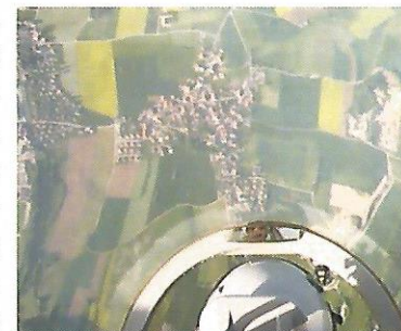
s'y attend pas. En piquée en dessus de Coffrane

Nous prenons directement la direction de Chaumont, où nous passons devant la tour du funi et longeons toute la crête depuis le Signal jusqu'au Près-Girard. Chaque quartier est bien reconnaissable malgré la vitesse. De là, nous allons effectuer une boucle par la Crêtée pour revenir sur le Val-de-Ruz et traverser Chaumont en direction de St.-Blaise. Une oppression se fait sentir. Effectivement le pilote effectue un « tonneau » avec l'avion. Cela surprend quand on ne